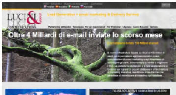
La home page del sito di Lucini & Lucini

Continua la crescita dell'azienda specializzata in email marketing e lead generation, capace di gestire nel corso del 2013 ben 40 miliardi di email inviate in tutto il mondo