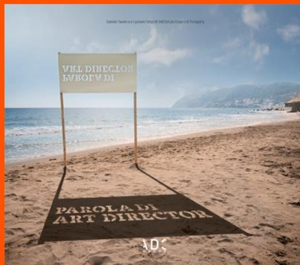
di Daniele Ravenna